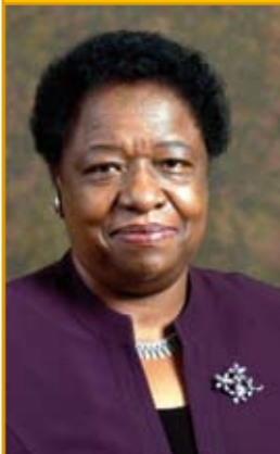
Moh BS Mabandla, MP, Tona ya Bosiamisi le Tlhabololo ya Molaotheo

Tšhata ya Tirelo ya Batswasetlhabelo ba Bosenyi mo Aforika Borwa (Tšhata ya Batswasetlhabelo) ke sediriswa se se botlhokwa mo tsweletsong ya bosiamisi mo bathong botlhe. Tšhata ya Batswasetlhabelo e dumalana le moonno wa Molaotheo wa Aforika Borwa, 1996, Molao 108 wa 1996, le Tlhomamiso ya Ditšhaba tse di Kopaneng ya Ditheo tsa Botlhokwa tsa Bosiamisi jwa Batswasetlhabelo ba Bosenyi le Tirisobotlhaswa ya Dithata, 1985 (GAVRES/40/34).